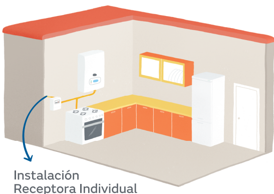
Instalación Receptora Individual

No pagarás nada al técnico en la visita.